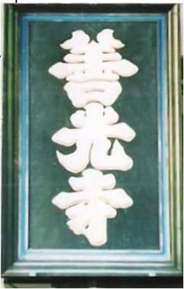
善光寺（長野県長野市）三門の額