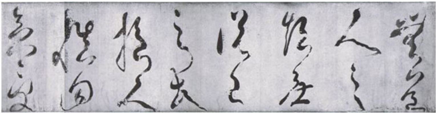
崔子玉座右銘 伝空海